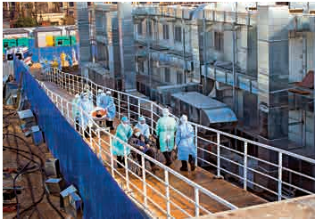
◀武漢市僅用十天火建成的火神山醫院，已開始收治新冠肺炎患者

疑似或確診新冠肺炎病人需隔離治療，截至昨日中午，醫管局有891張隔離病床分布在470間負壓病房，病床使用率達37%，病房使用率更高達53%，但疫情目前仍未見盡頭，負壓隔離病房需求料有增無減。