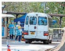
▲現時三個新冠肺炎檢疫中心合共97個單位，已使用86個，接近飽和

政府發言人重申，確診及懷疑感染新冠肺炎的患者，在醫院接受隔離處理。獲安排入住檢疫中心或居家檢疫的人，都不是確診或懷疑感染病人，而是沒任何病徵的密切接觸者或於14天內曾到湖北省的人。